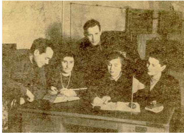
Рис. 2. Группа управления и магнитной памяти