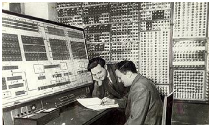
Рис. 4. Комплексная отладка МЭСМ